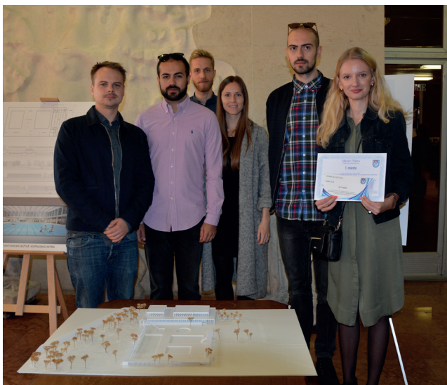
Autori víťazného návrhu dostavby kúpaliska s celoročným využitím z bratislavského ateliéru NOIZ.

miest, opravách ciest a hlavne chodníkov. Máme záujem aj o prilákanie turistov do nášho mesta, nakoľko si myslím, že Nitra má potenciál aj atrakcie, ktoré by ich mohli zaujať. (SY)