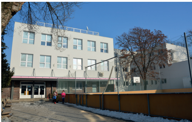
V minulom roku bola zrekonštruovaná ZŠ kniežaťa Pribinu na Ul. Fraňa Mojtu.

Podarilo sa nám zrekonštruovať ZŠ Tulipánová, ZŠ Škultétyho, ako aj najstaršiu nitriansku ZŠ kniežaťa Pribinu. Pri bytoch na sídliskách pribudli nové parkovacie miesta, opravené boli viaceré chodníky, ulice a námestia, ako napríklad priestor pred