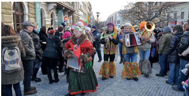
Aj tento roku prejde po pešej zóne fašiangový sprievod.

Veselý fašiangový sprievod vykročí na pešiu zónu o 16.