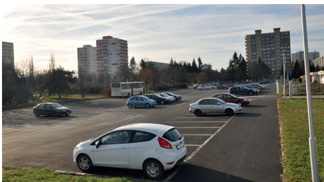
Nový asfaltový koberec dostalo aj parkovisko pred Atletickým štadiónom na Chrenovej.

žovciach, ktorá nám prinesie nielen nové pracovné miesta – 2800 pracovníkov, ale bude prínosom aj pre ďalší rozvoj Nitry i celého regiónu.