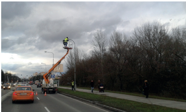
V Nitre sa v priebehu posledných dvoch rokov modernizovalo verejné osvetlenie. Vymenených bolo celkom 1350 svietidiel.

Máme pripravenú dokumentáciu na výstavbu kúpaliska s celoročným využitím a určite budeme radi, keby sme dali dohromady aj futbalový štadión. Sme tesne pred dokončením verejného obstarávania a pokiaľ budeme mať zhotoviteľa, tak sme pripravení na to, aby rekonštrukcia prebehla. Okrem týchto akcií pokračujeme v opravách ciest a chodníkov. Chceme dať priestor pre výbory mest-