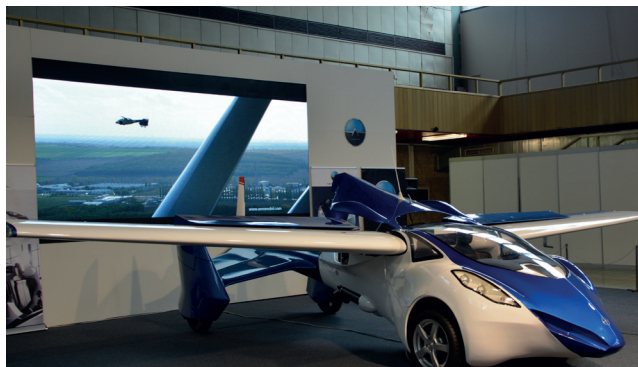
Prezentácia aeromobilu bola aj na strojárskom veľtrhu na Výstavisku Agrokomplex.

Ja však nechcem byť súčasťou organizovanej výroby, to nechám na profesionálov.“