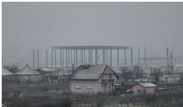
Výstavba areálu automobilky Jaguar Land Rover je v plnom prúde aj napriek zimným mesiacom.